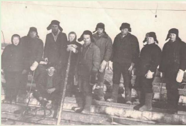
Бригада рабочих нижнего склада Исаневского лесопункта на разделке леса. Зима 1970 г.