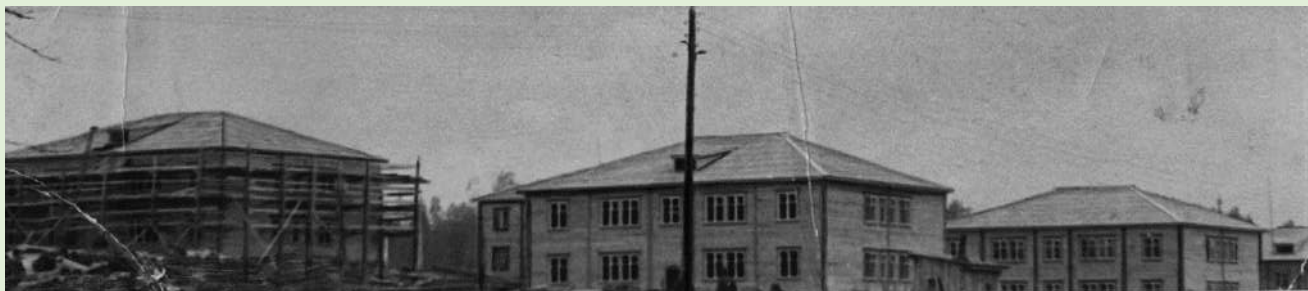
Квартал новых домов в посёлке Копса. 1965 г.

Силами леспромхоза построены школы в пп. Визиндор и Заозерье, клубы, общественные бани в пп. Заозерье, Первомайский, Бортом и Визиндор, объекты торговли и общественного питания в пп. Заозерье, Первомайский, Бортом и Визиндор, Щугрэм.