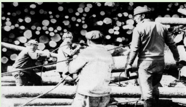
Строповщики на скате древесины в Щугромском лесопункте зацепляют очередную пачку древесины. 1980 г.