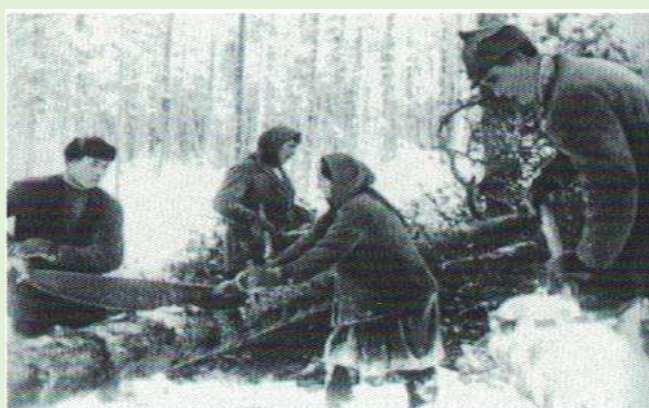
Разделка древесины и обрубка сучьев. 1930-е гг.