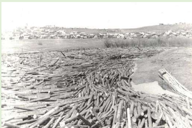
Большой затор сплавных брёвен на реке Большая Визинга.

К концу 1950-х годов леспромхоз из сезонного, полукустарного типа превратился в предприятие круглогодичного действия, базирующееся на механизированных лесовозных дорогах. В 1960-е гг. продолжалось дальнейшее совершенствование механизации всего лесозаготовительного процесса, который состоял из нескольких стадий: валка деревьев производилась валочными машинами либо бензомоторными пилами, подвозка леса – трелевочными тракторами, обрубка сучьев – сучкорезными установками, поточными линиями либо топорами, погрузка деревьев – тракторами, челюстными погрузчиками, вывозка автомашинами либо узкоколейными железными дорогами и сплавом, разделка хлыстов – полуавтоматическими поточными линиями либо бензопилами, электропилами, штабелевка – штаблерами, кранами, лебедками разных марок.