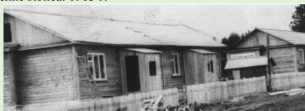
Вид двухквартирных домов-новостроек для лесозаготовителей. 1981 г.

За восемь десятилетий своего существования и плодотворной деятельности Сысольский леспромхоз (в последнее время с изменёнными названиями) выдал для нужд Республики Коми и страны многие миллионы кубометров «зелёного золота». Предприятие не раз получало награды высшего руководства страны за достижение наивысших результатов во Всесоюзном социалистическом соревновании, большой вклад в которых вносили трудовые династии, на представителях которых держались бригады лесопунктов и цеха предприятия.