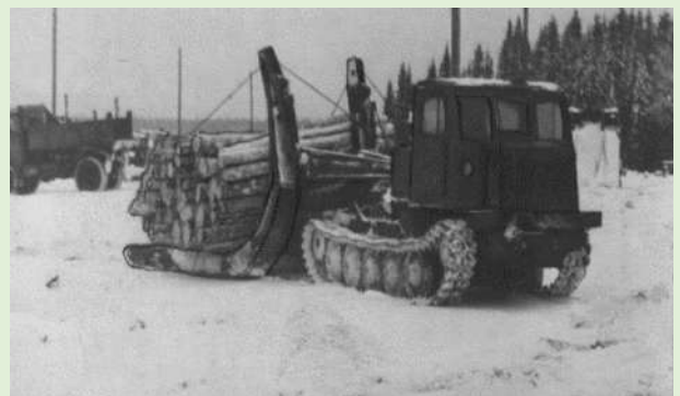
Сплоточный агрегат «В-43» Сысольского сплаваучастка в работе. 1981 г.