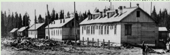
Новые дома в Черёмушках п. Заозерье. 1970 г.