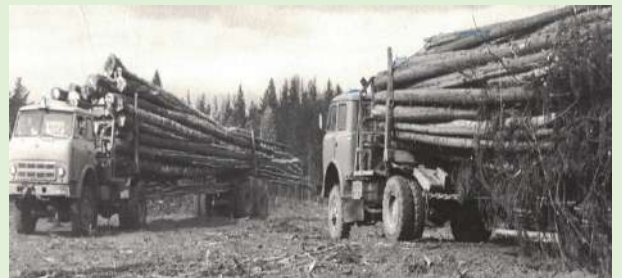
Механизированная вывозка древесины промежуточного склада Бортомского лесопункта. 1977 г.