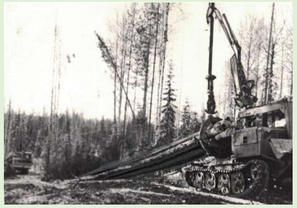
Трелёвка бесчокерным трактором ТБ-I на Щугромском лесопункте. Февраль 1970 г.