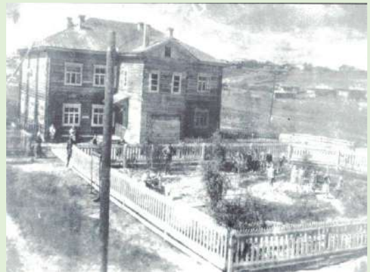
Контора промкомбината с первыми домами по улице Набережной 60-е годы 20-го столетия.

В послевоенные годы предприятие перешло на производство «мирной» продукции. Нарастивалось производство пиломатериалов, кирпича, товаров широкого потребления, швейных и гончарных изделий. Нужны были новые помещения, здания, производственные площади.