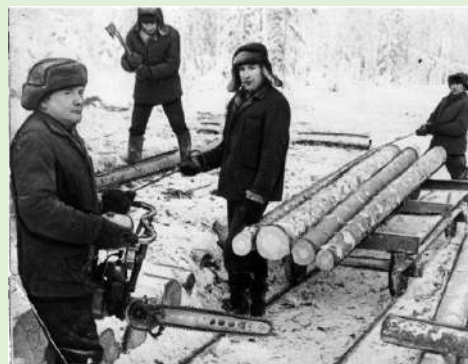
Члены бригады по заготовке леса Визингского лесопункта за работой. 1979 г.

Большие изменения в улучшении условий труда, в техническом оснащении произошли и на других участках производства: в мебельном, череночном, линеечном цехах. Например, внедрение линеечного станка-полуавтомата в линеечном цехе позволило удвоить производство ученических линеек и удешевить их себестоимость. Ученические линейки с маркой Визингского КБО шли в 22 города Советского Союза.