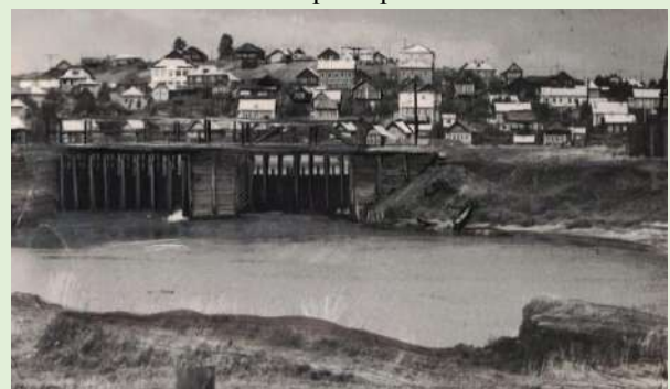
Общий вид плотины на реке Большая Визинга. 1972 г.