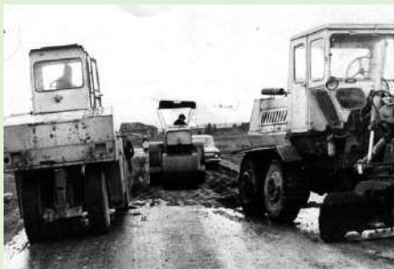
Идёт укладка асфальта на дороге Визинга-Горьковское, грейдер и каток во время работы. 1981 г.