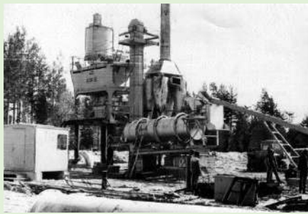
Новый асфальто-бетонный завод СДРСУ для строительства дороги Визинга-Койгородок у п.Подзь. 1984 г.