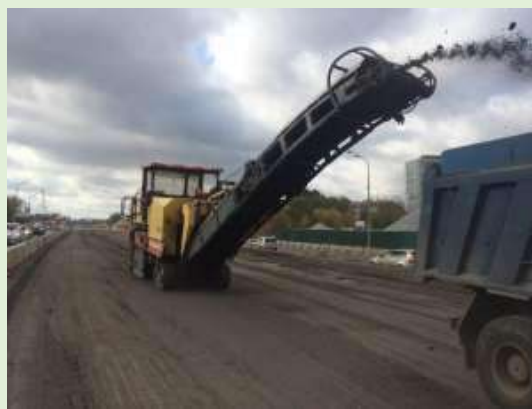
Срез старого слоя асфальта фрезой с погрузкой в кузов самосвала в Первомайском.

За время своего существования дорожные организации района неоднократно меняли свое название, сохраняя свои функции – ремонт и обслуживание дорог не только в пределах района, но и по всей территории республики.