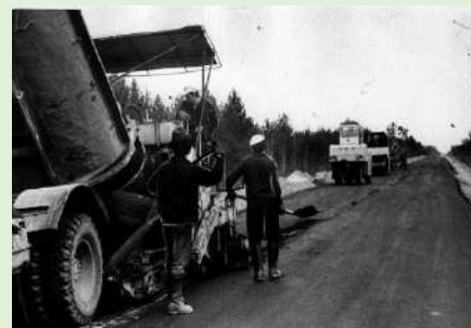
Идёт асфальтирование дороги к п.Подзь Койгородского района. 1985 г.

Из года в год предприятие наращивает основные фонды, а это новые машины и агрегаты, меняется инфраструктура. В 1990 –е годы, кроме основной работы – строительства и реконструкции автодорог, предприятие продолжает строить жилье, заниматься заготовкой леса, приобретает пилораму, развивается подсобное хозяйство.