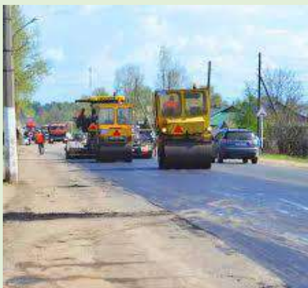
Укладка асфальта ООО «ДСК-Карьер»

Из года в год предприятие наращивает основные фонды, а это новые машины и агрегаты, меняется инфраструктура. В 1990 –е годы, кроме основной работы – строительства и реконструкции автодорог, предприятие продолжает строить жилье, заниматься заготовкой леса, приобретает пилораму, развивается подсобное хозяйство.