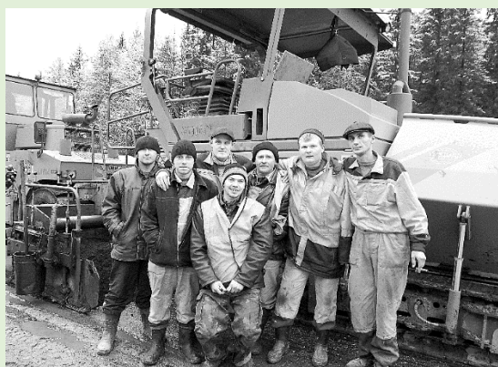
Рабочие ремонтного звена ОАО «Комидорстрой» на укладке асфальтобетона. 2009 г.

За время своего существования дорожные организации района неоднократно меняли свое название, сохраняя свои функции – ремонт и обслуживание дорог не только в пределах района, но и по всей территории республики.